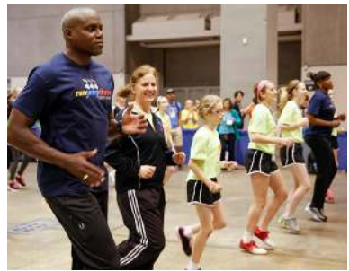
Las leyendas olímpicas Carl Lewis y Jackie Joyner-Kersey conducen una sesión de aptitud física en el anuncio de RunJumpThrow durante la conferencia de SHAPE America en St. Louis.

En 2014, Hershey estableció RunJumpThrow (Corran, salten, lancen), una asociación de siete años con USA Track & Field (USATF) y Athletics Canada, como parte de una nueva iniciativa nacional de actividades juveniles. Diseñada para introducir a los niños de 7 a 12 años a las habilidades básicas de correr, saltar y lanzar, esta iniciativa representa nuestro compromiso de larga data para lograr que los niños se entusiasmen con la actividad física. El programa se lanzó oficialmente en 2015.